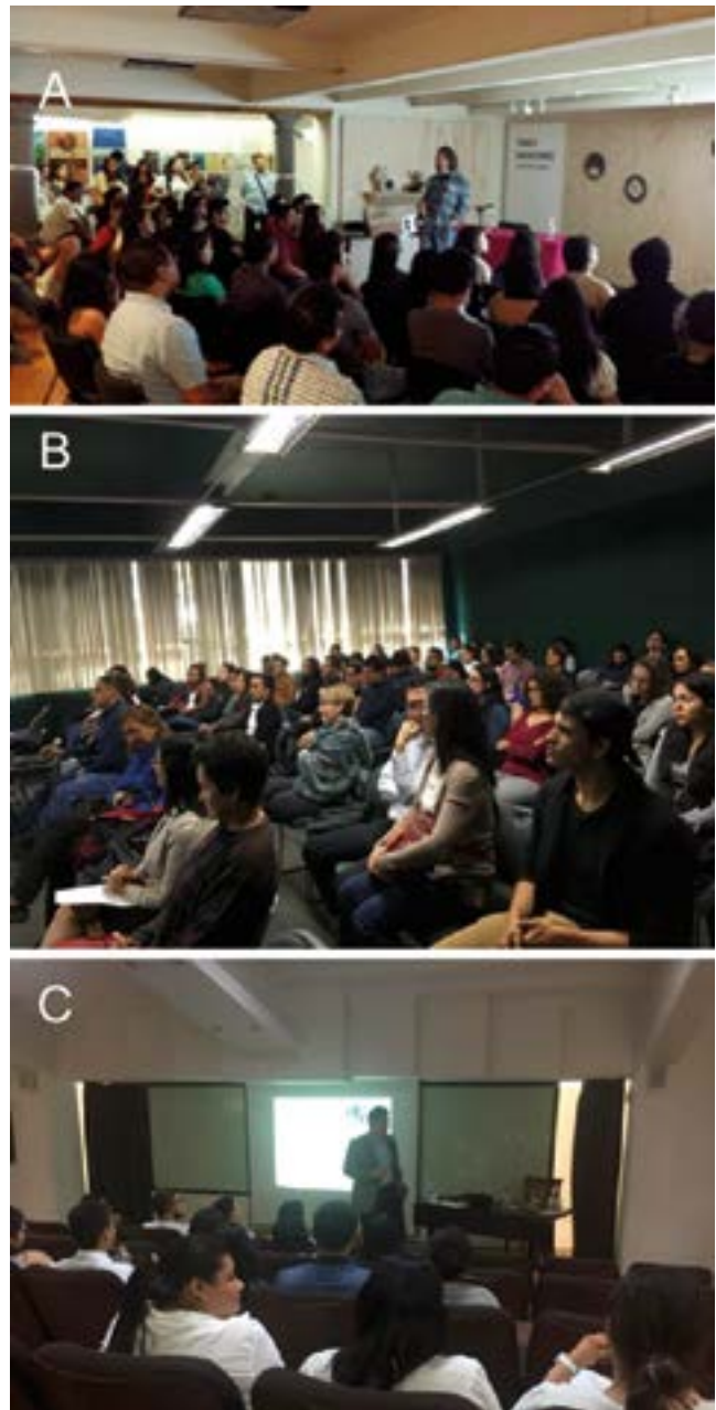
Figura 4. Conferencias entre pares. Cada año, a excepción de 2018, se presentaron cuatro pláticas especializadas dirigidas a los estudiantes universitarios, de carreras afines en un simposio. Las sedes han ido cambiando con la finalidad de llegar a un número mayor de universitarios. A) Ágora de la ciudad, B) Facultad de Medicina y C) Auditorio de la Universidad Anáhuac.

La divulgación del quehacer científico constituye una herramienta importante, pues promueve que el conocimiento generado en los laboratorios de investigación llegue a oídos del público ajeno a estas actividades, rompiendo barreras, como la relacionada con el estrato social. Cabe mencionar que las habilidades para desarrollar estrategias eficaces, que permitan la comunicación de la ciencia, muchas veces no son abordadas por estancias académi-