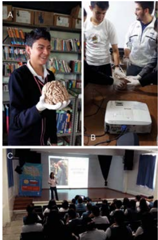
Figura 2. Estudiantes de preparatoria conociendo la morfología del cerebro. A) Estudiante observa las circunvoluciones de un cerebro humano. B) Estudiantes experimentando con la textura del cerebro, aprendiendo sobre su composición. C) Grupo de preparatorianos escuchando una plática con mucha atención.

Con esta actividad se detectaron algunos estigmas y tabúes sobre las enfermedades mentales, pues un gran porcentaje de la población los desconoce. Aunado a esto, el miedo a lo desconocido, traducido en ignorancia y discriminación, puede ser eliminado con el conocimiento, y mejor aún, si es transmitido a través de un buen rato de cine. Se constató que gran parte de la población no entiende la naturaleza de la esquizofrenia o la depresión, por mencionar algunos ejemplos. La gente tiende a aislar y discriminar a este tipo de pacientes. Con la discusión de las películas,