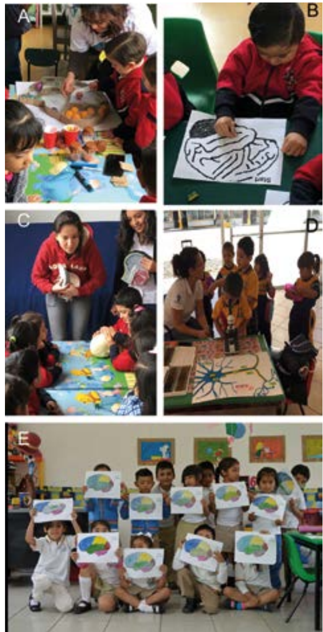
Figura 1. Participación de preescolares en la Semana Internacional del Cerebro. A) Niños de preescolar conociendo la regionalización de la corteza cerebral a través de actividad lúdica. B) Niño aprendiendo que el cerebro nos sirve para la resolución de problemas, como un laberinto. C) Breve plática sobre funciones del cerebro. D) Relación de las regiones de cerebro con algunas funciones. E) Observación y reconocimiento de las células del sistema nervioso central.

A través de la Feria del Cerebro y el taller “Ramiro y el reloj mágico”, los niños tuvieron la oportunidad de conocer de manera general el sistema nervioso, sus componentes y algunas de las funciones que rigen la vida de los seres humanos, resaltando la importancia del cerebro, así como la manera en que deben cuidarlo. El aprendizaje ocurrió a través de manualidades, juegos, resolución de problemas y dinámicas de grupo. De esta manera, el aprendizaje, mezclado con la diversión, permitió tener una alta participación de este sector tan importante de nuestra sociedad (Fig. 1).