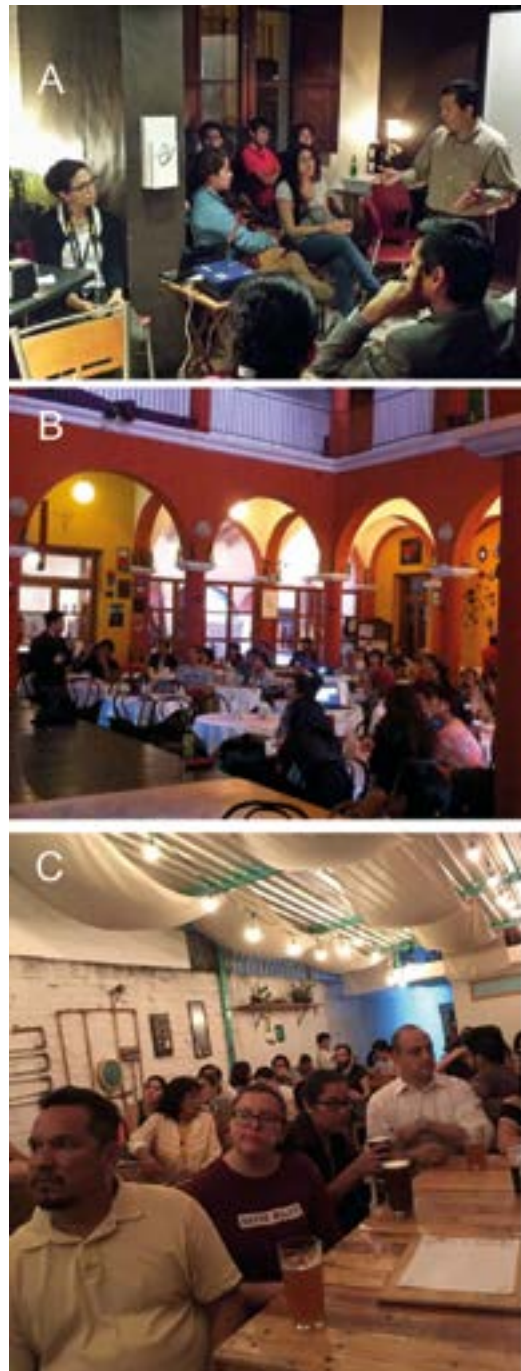
Figura 3. Conferencias en establecimientos públicos. Pláticas dirigidas al público en general en cafés y bares de la ciudad de Xalapa. A) Café Jarocho Style, B) Café Teatro Tierra Luna y C) Bar Zona de Niebla. Las tres sedes han captado a un importante número de asistentes, acercando a la gente a la búsqueda de conocimiento.

Esta actividad fue dirigida a la comunidad académica para desencadenar charlas entre pares. En cada emisión se tuvieron diversas sedes, pues la audiencia era mayor cada vez. En 2015 se llevó a cabo en el Ágora de la Ciudad; en 2016 y 2017, en el auditorio de la Facultad de Medicina, y en 2019, en el de la Universidad Anáhuac. Esta estrategia fue bien recibida por los universitarios, no solo como asistentes, sino como expositores.